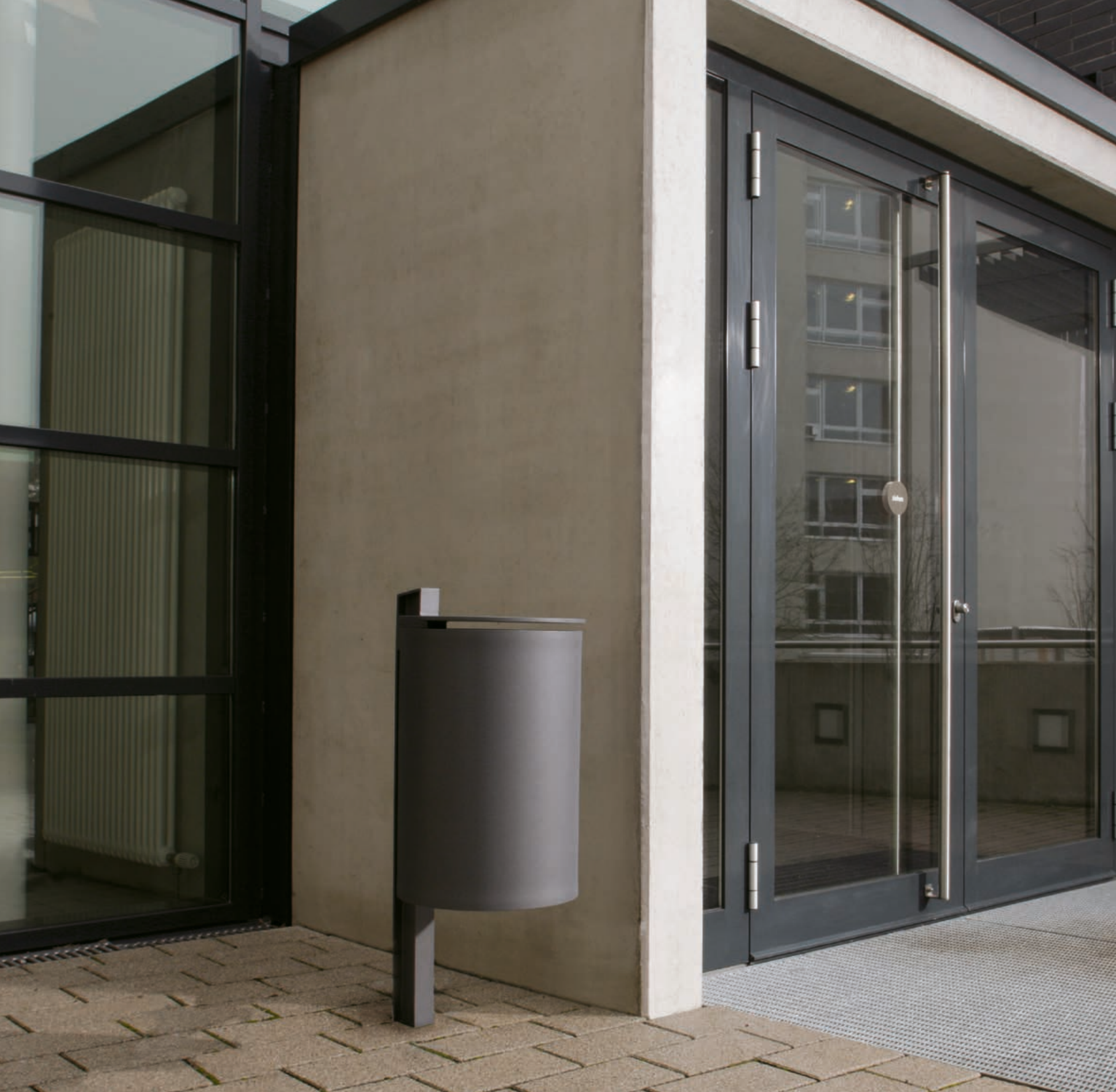
PUNTO VILLINGEN-SCHWENNINGEN . DEUTSCHLAND